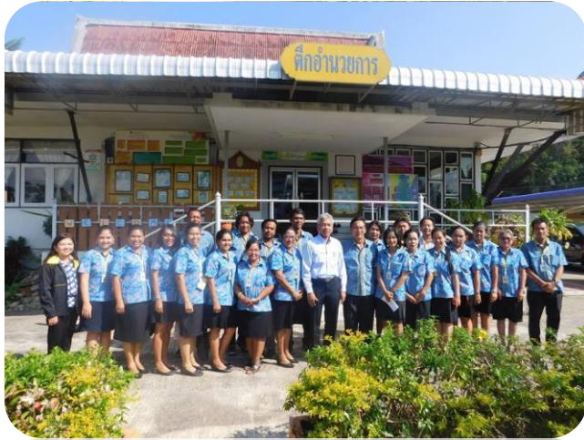
บุคลากรศูนย์พัฒนาการจัดสวัสดิการสังคมผู้สูงอายุบ้านทักขิณ